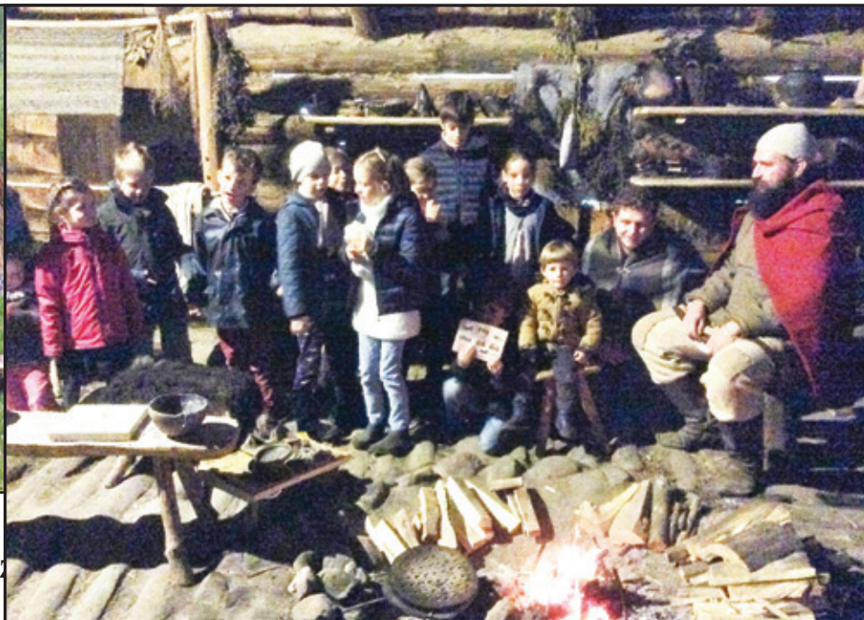
Pielgrzymka Wspólnoty Francuskojęzycznej