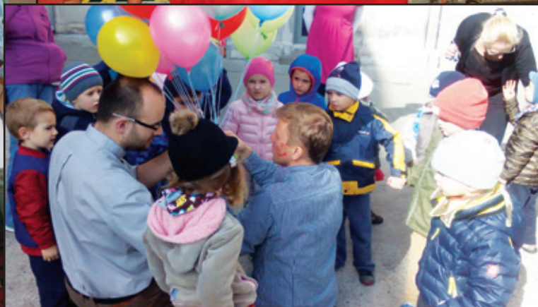
Na rekolekcjach dla dzieci „Spotkanie z Chrystusem”.