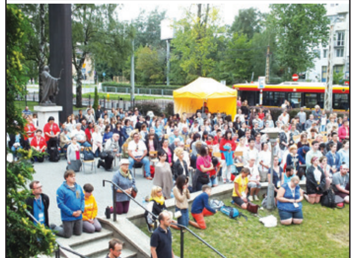
W naszej Parafii przed Światowymi Dniami Młodzieży w Krakowie, 2016 rok.