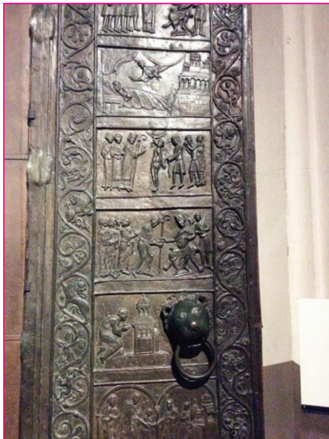
Przejście przez bramę miłosierdzia. Drzwi katedry gnieźnieńskiej.

zją do umocnienia braterskich więzi, jakie jednoczą wspólnotę. Dały również sposobność do przyjęcia nowo przybyłych do naszej Parafii. Był to także czas wspólnej modlitwy i odkrywania Polski wraz z jej historią.